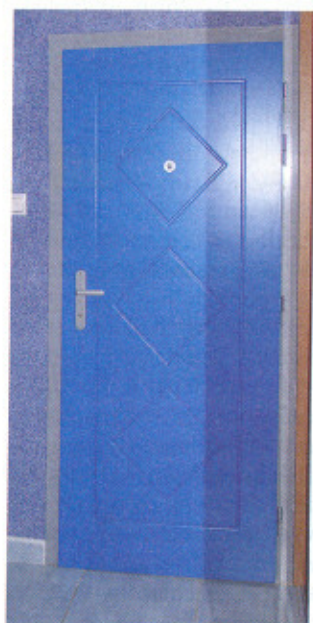
Vonkajšia a vnútorná časť dverí sa môže odlišovať. Dvere v panelovom dome sú z vonkajšej strany hladké, z vnútornej strany sú v štýle interiéru. Profilovaný povrch sa dosahuje frézovaním drážok. (ADLO – Bezpečnostné dvere)

V našom byte alebo rodinnom dome sa v prvom rade musíme cítiť príjemne. Preto si svoje bývanie zariaďujeme tak, aby bolo pohodlné a príjemné. Venujeme čas výberu pohovky, televízora, peknej podlahy, ale často zabúdame na vlastnú bezpečnosť. Náš svet od okolitého sveta oddeľujú dvere.