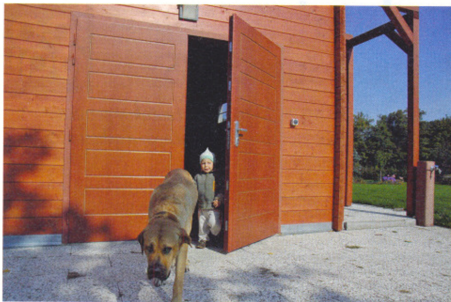
Veľké dvojkrídlové bezpečnostné dvere môžu bezpečne uzavrieť aj garáž na menšie auto. (ADLO – Bezpečnostné dvere)