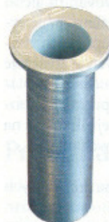
Istiaci bod zabetónovaný do podlahy sa považuje za neprekonateľný. (ADLO – Bezpečnostné dvere)

Záujemcovia o kúpu bezpečnostných dverí si môžu vybrať úroveň bezpečnosti, dizajn, kovanie, vložku s kľúčmi, príslušenstvo, osadenie, montáž buď do pôvodnej, alebo do novej bezpečnostnej zárubne, rozmery (výšku až do 250 cm), zasklenie, počet krídel (jedno- alebo dvojkrídlové), interiérové alebo exteriérové (zateplené, tzv. termo, dvere), so svetlíkmi a nadsvetlíkmi alebo bez nich.